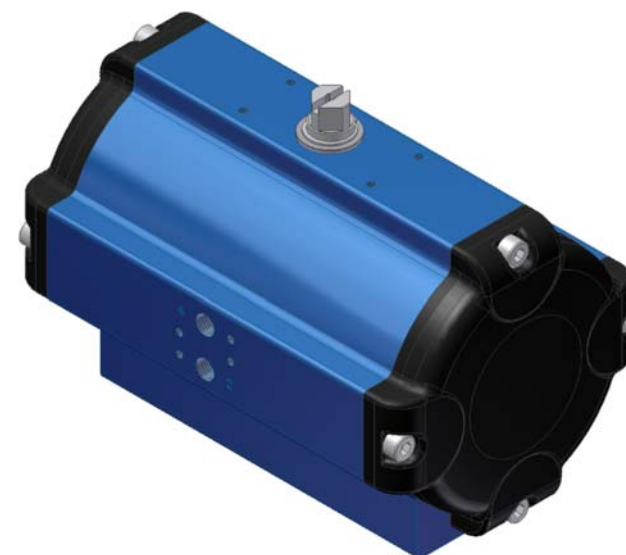
SAD - 135°